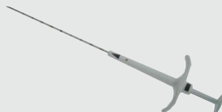
Cãnula de introdução do VMark