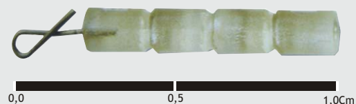
Marcador de biópsia VMark