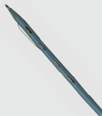
Catéter montado com agulha